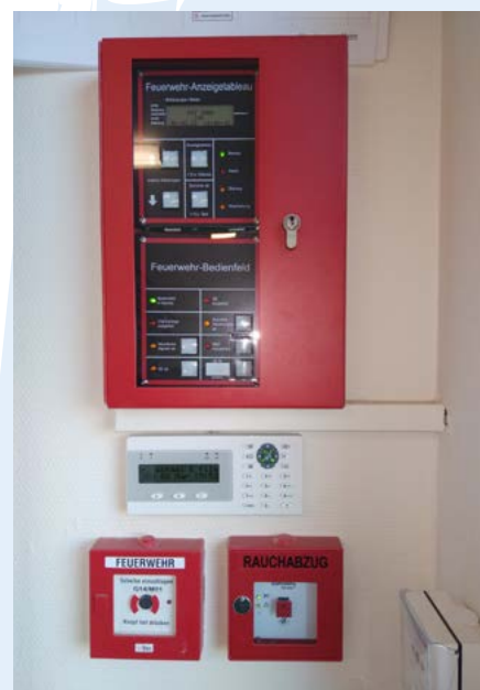
De branddetectiecentrale wordt verplicht in elk jeugdverblijf.

Ook binnen het logiesdecreet kunnen (nieuwe) afwijkingen worden aangevraagd. Dit verloopt via de technische commissie brandveiligheid. De commissie formuleert in dat geval oplossingen zodat het veiligheidsniveau behouden blijft.