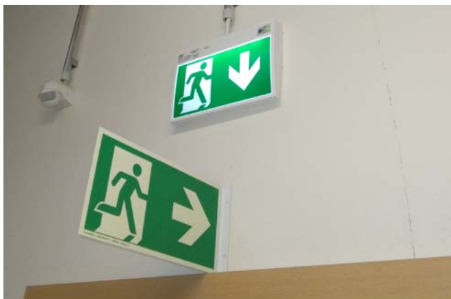
In principe zijn er overal twee afzonderlijke vluchtwegen nodig.