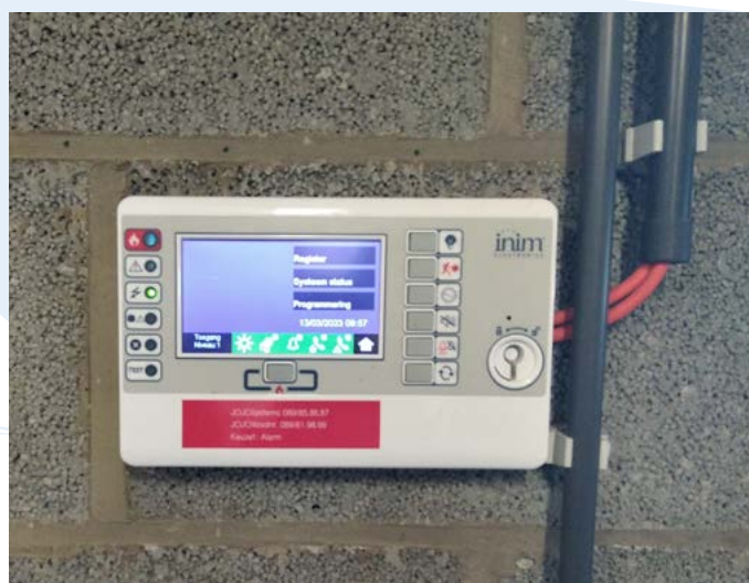
De keuze voor een branddetectiecentrale kan niet gemaakt worden zonder risicoanalyse.

Voor het overige dient in elke ruimte minstens één detector geplaatst te worden, dus ook in bergingen, inkomhallen enz.