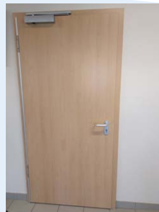
In het logiesdecreet wordt meer belang gehecht aan deurpompen.

wanden, vloeren en zolderingen dienen een brandweerstand van 60 minuten te hebben en deuren moeten zelfsluitend of bij brand zelfsluitend zijn en een brandweerstand hebben van 30 minuten.