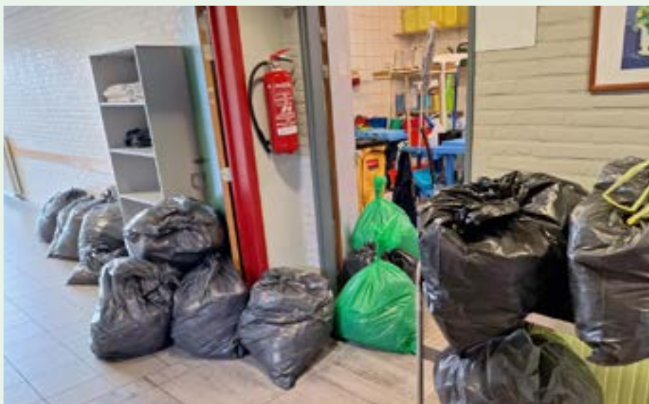
In Vakantiehuis Fabiola werd na een vermoeden van bedwantsen alles meteen in zakken gestoken.

We hebben dit keer meteen honden laten komen. Er bleken maar twee kamers last te