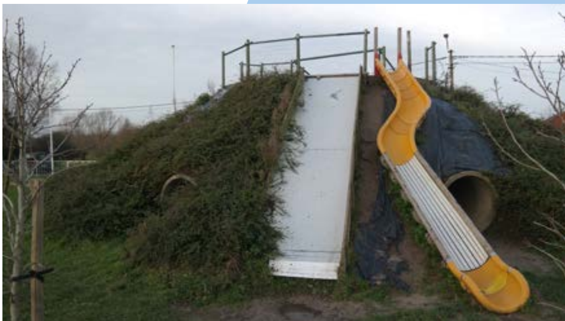
Op vraag van de burens werd de speelheuvel met twee meter verlaagd.