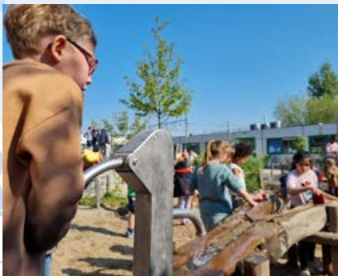
Minder verveling betekent minder conflicten