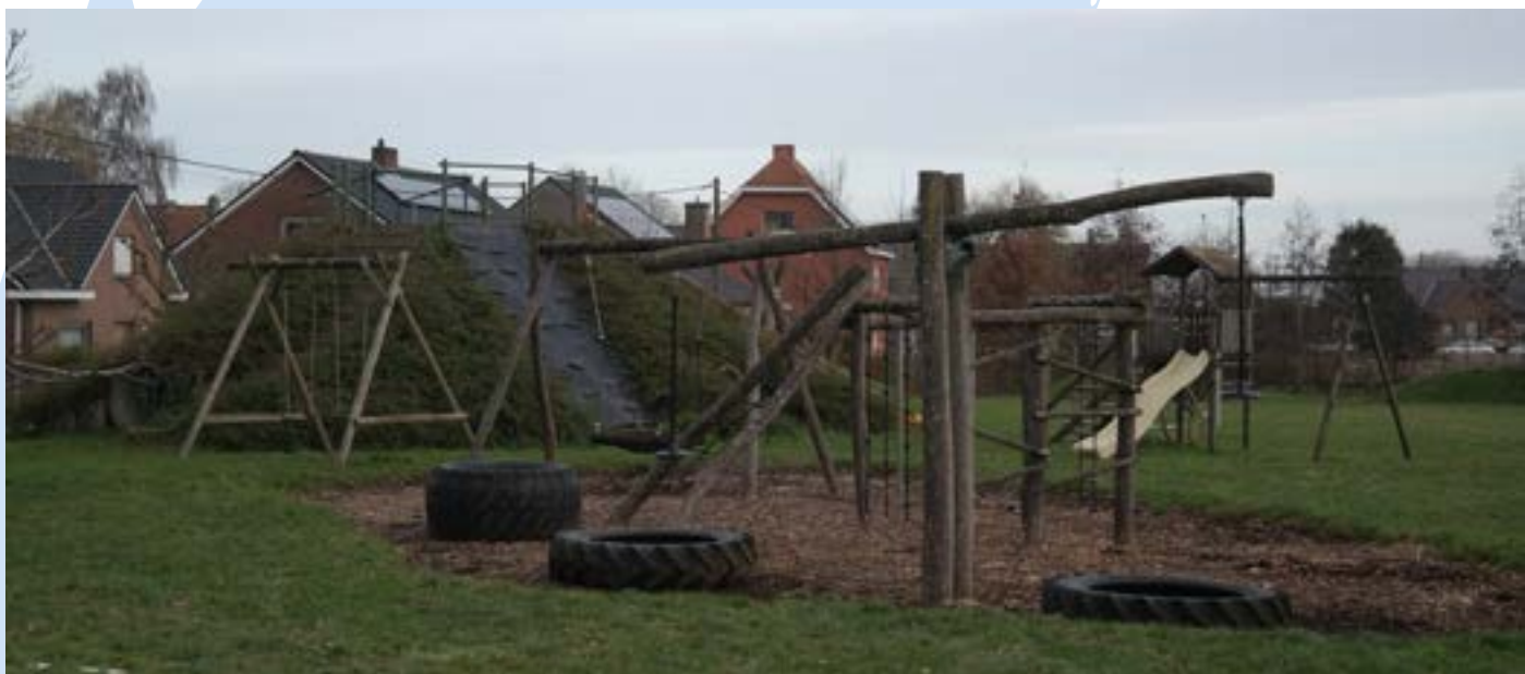
Een speelterrein is steeds in evolutie en nooit helemaal klaar.