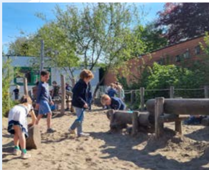
Een goed doordachte aantrekkelijke buitenomgeving zorgt voor weinig extra werk of onderhoud.

groendienst van Kortrijk. Die komen één keer per jaar de bomen en struiken snoeien en het bloemenmengsel maaien. Verder blijft het onderhoud beperkt tot wat structurele klusjes (bijv. ontstoppen van rioolputje) en kleine herstellingswerken (bijv. vernieuwen van qr-codes). Er is dus extra werk, maar dat is beperkt en staat niet in verhouding tot het extra spelplezier dat kinderen en jongeren hier hebben.