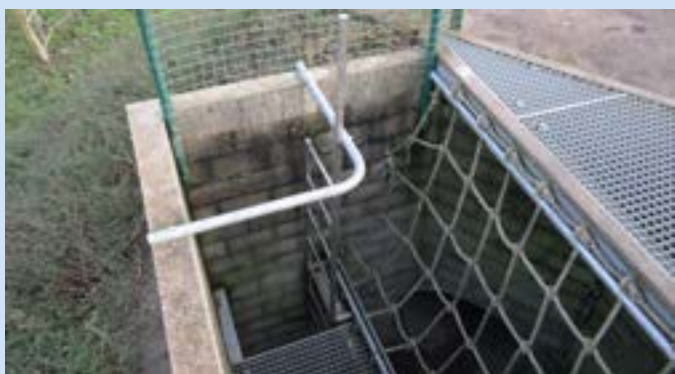
De speelheuvel, met o.a. een daalmast, is de meest favoriete plek van de kinderen.