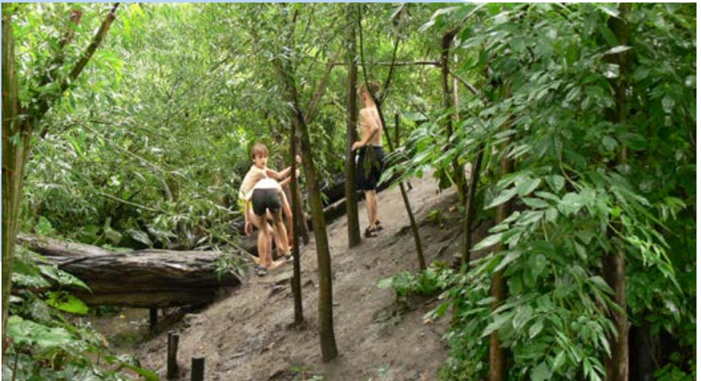
Een domein kan met enkele gerichte ingrepen een heel gevarieerde speelomgeving worden.

constructiespel ook heel waardevol. Zo verwerven kinderen ruimtelijk inzicht en voorstellingsvermogen.