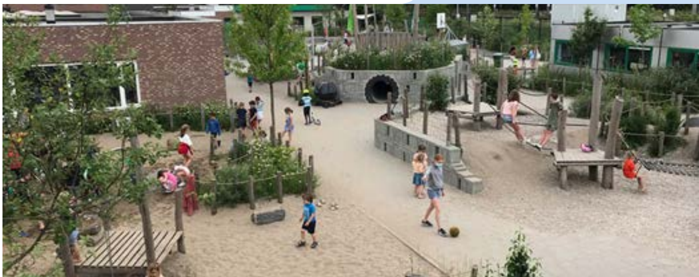
Reliëf, waterpartijtjes, hindernissen en speeltoestellen zorgen niet voor meer ongevallen.

hierdoor binnen de perken, los van het feit dat we sindsdien ook enorm besparen op onze drinkwaterfactuur.