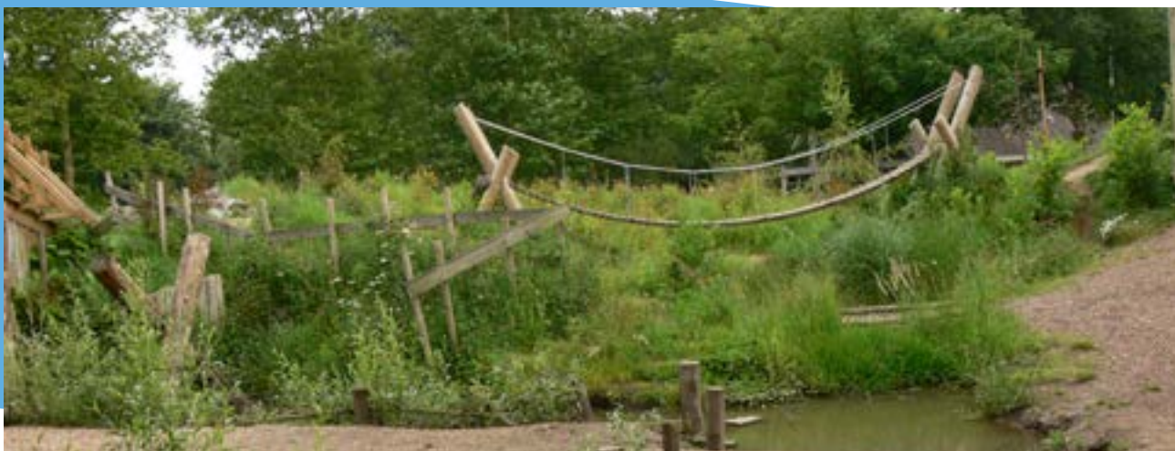
Bij spelen hoort vallen en opstaan.