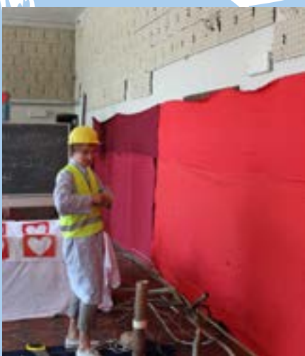
Veel groepen vinden het belangrijk om het lokaal zelf te kunnen aankleden.

Om scholen over de streep te trekken, is een programma à la carte echt een unieke meerwaarde, dit ontlast de leerkracht effectief. We proberen alle kinderen en ouders heel enthousiast te maken door er op voorhand in de klas mee bezig te zijn. We hebben ook kansgezinnen, maar we hebben een sociaal fonds zodat alle kinderen meekunnen. Als er drempels zijn, krijgen we mensen goed overtuigd als we onze ervaringen vertellen over de warme en hartelijke ontvangst in Koksijde.