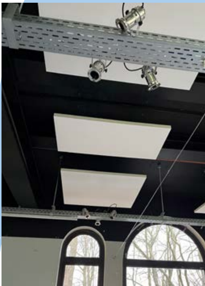
In jeugdverblijf Heiberg maakt Koning Kevin ruimte gebruiksvriendelijk en multifunctioneel door akoestische panelen, gespannen kabels en goten.