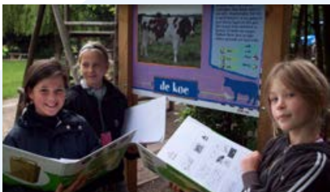
Op wegwijzers van het landbouwleerpad staan vragen op de voorkant en antwoorden op de achterkant.