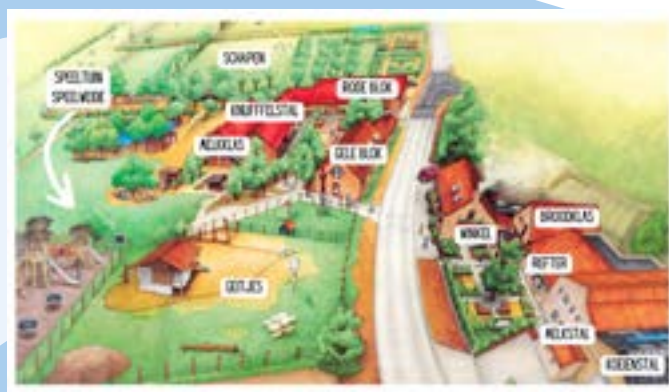
In De Vierhoekhoeve valt heel wat te beleven.

getuigenis gegeven op onze opendeur, als verrassing voor ons. Ze vertelden over wat onze boerderijklas voor hen betekend heeft en dat is toen wel hard binnengekomen. Dan pas zag je echt wat je gezaaid hebt in de harten, wat dat met kinderen doet, wat ze ervan onthouden en wat doorwerkt in hun leven. Zeker als je een kind vijf dagen kan onderdompelen, krijg je veel meer die aha-erlebnis. Ze zien een spade, ze zien een ploeg, ze zien van alles groeien op het veld. De mais geven ze aan de koeien, maar mais zit ook in het atelier melkverwerking. Van het vet van de melk maken we room en zo dan slagroom en boter. Je ziet de kinderen denken en verbanden leggen voor je neus, je ziet in hun ogen dat ze het allemaal aan elkaar knopen.