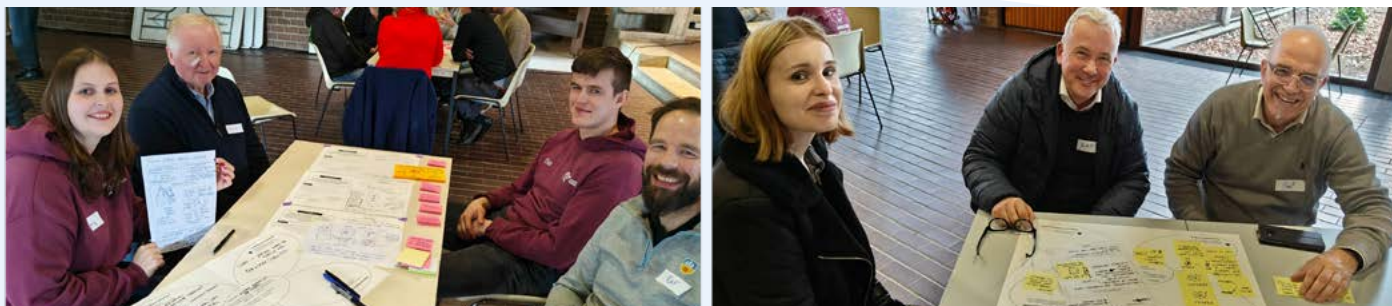
Tijdens ons proces hebben we regelmatig onze ideeën afgetoetst bij uitbaters, jeugdwerk en burens.