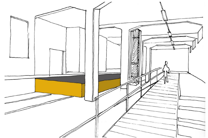
Een OPEK voor de toekomst – Leuven

“Iedereen kan op een gelijkwaardige en onafhankelijke manier alle functionele ruimten bereiken, betreden, gebruiken en begrijpen”