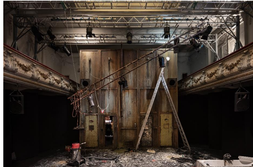
Theater Nona Mechelen