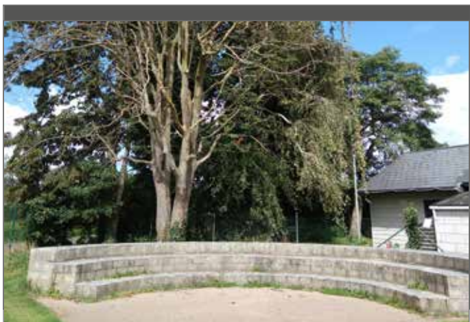
Gebruik dode beplanting als trigger om na te denken over natuurlijke spelelementen.