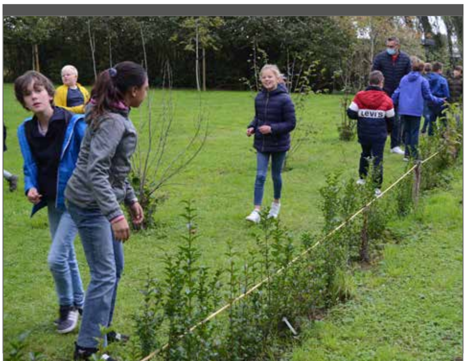
BOS+ voorziet opnieuw financiële middelen en ondersteuning voor vergroening van terreinen.

Volg de aanplant goed op! Controleer zeker in de lente en zomer na de aanplant of de bomen en struiken voldoende vocht hebben om te kunnen groeien en geef ze water als dat nodig is.