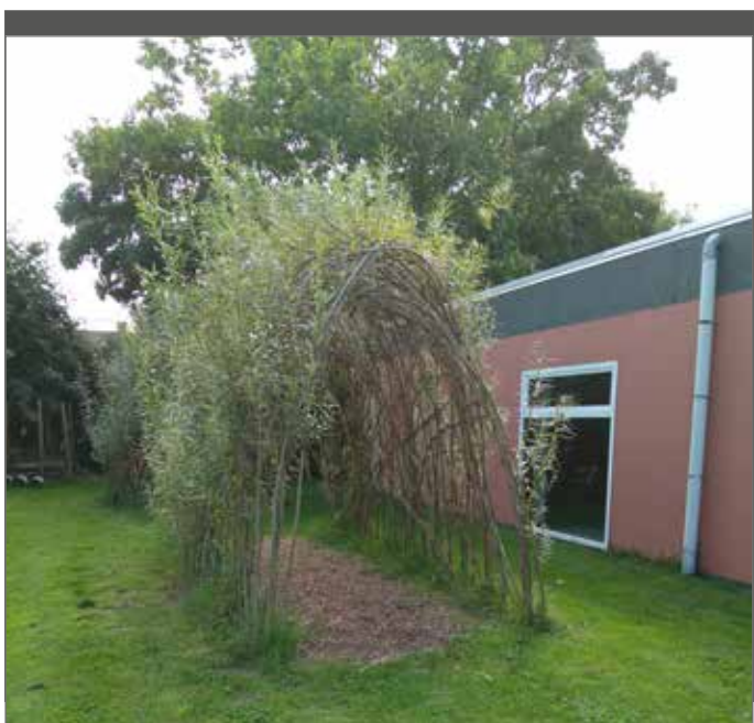
Een wilgentunnel is een leuk natuurlijk spelelement.