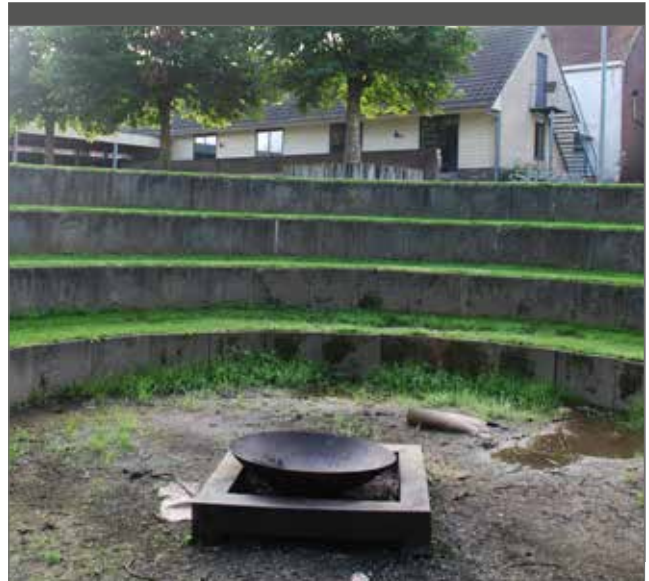
Door de aanwezigheid van een amfitheater, een open plein, een beek en een bos wordt elk type kind geprikkeld om te spelen.

Omdat ik in de branche zit, heb ik heel wat werkmateriaal dat ik ter beschikking kan stellen. De vrijwilligers weten dat en maken er gebruik van, maar eigenlijk hebben de meeste vrij-