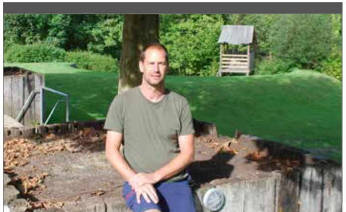
Koen: "Wie niet houdt van balspelen, kan bruggetjes bouwen of verstoppertje of tikkertje spelen."

Absoluut. In de zomermaanden mogen we ons steeds meer verwachten aan hittegolven. Het creëren van schaduw voor de verblijf