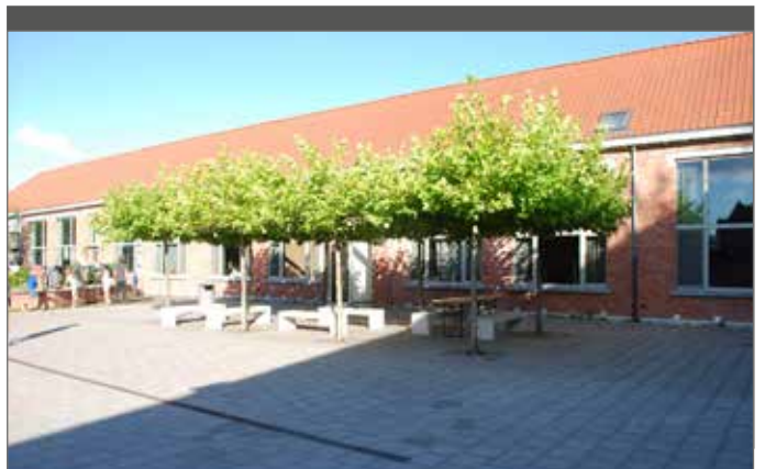
Beplanting zorgt voor natuurlijke schaduw.