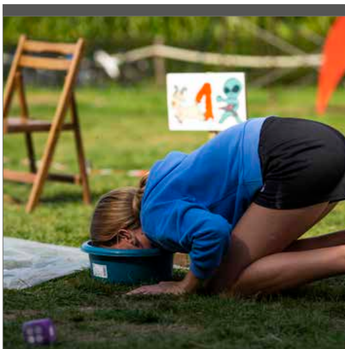
Op het principe van uitbetalen van schadevergoeding is één uitzondering, nl. overmacht.

Er kan discussie zijn over de directe oorzaak die ervoor zorgt dat een verblijf niet kan doorgaan. Opnieuw toonde corona aan dat dit niet altijd even duidelijk is. Zo is er een groot verschil tussen het annuleren van een verblijf onder bevel van de overheid en het preventief annuleren van een verblijf uit angst voor besmettingen.