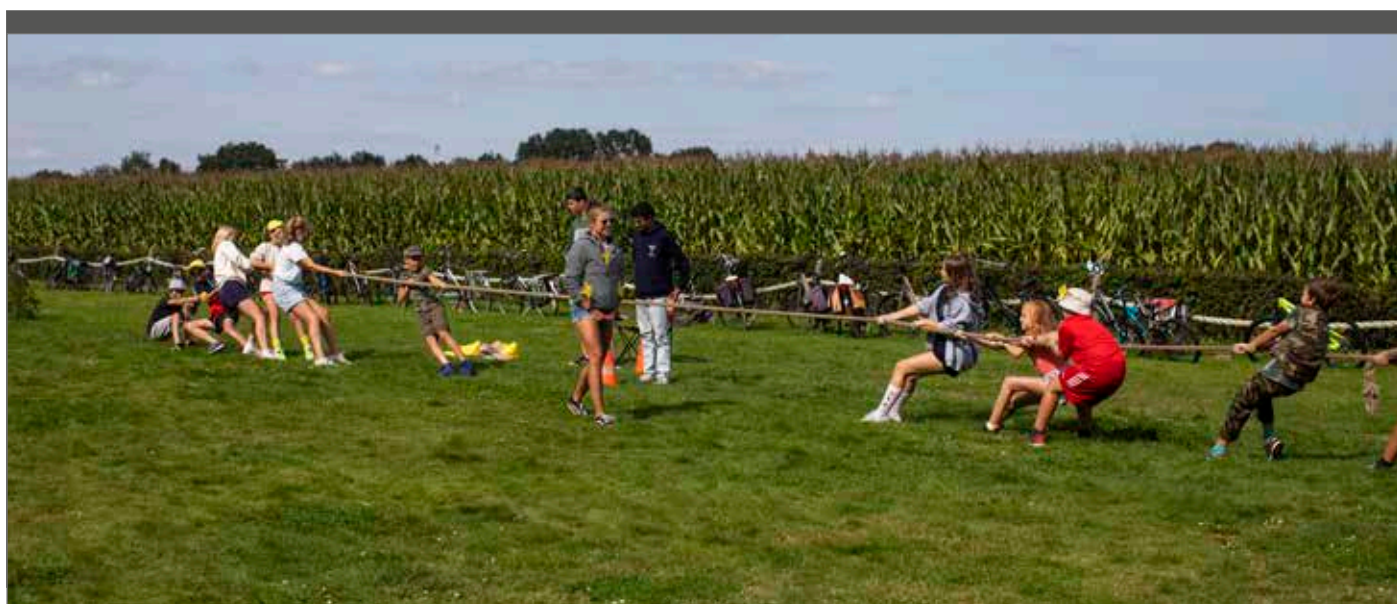
Dat er weinig tot geen juridische dreigementen en veldslagen gekend zijn, is toe te juichen.

De inhoud van dit dossier onderwerpen we aan een juridische check bij Charlier Advocaten. Daarnaast gingen we in gesprek met de uitbaters van onze redactieraad (zie colofon) en een delegatie van de beleidswerkgroep jeugdtoerisme van De Ambrassade. Aan allen dankjewel voor de nuttige feedback!